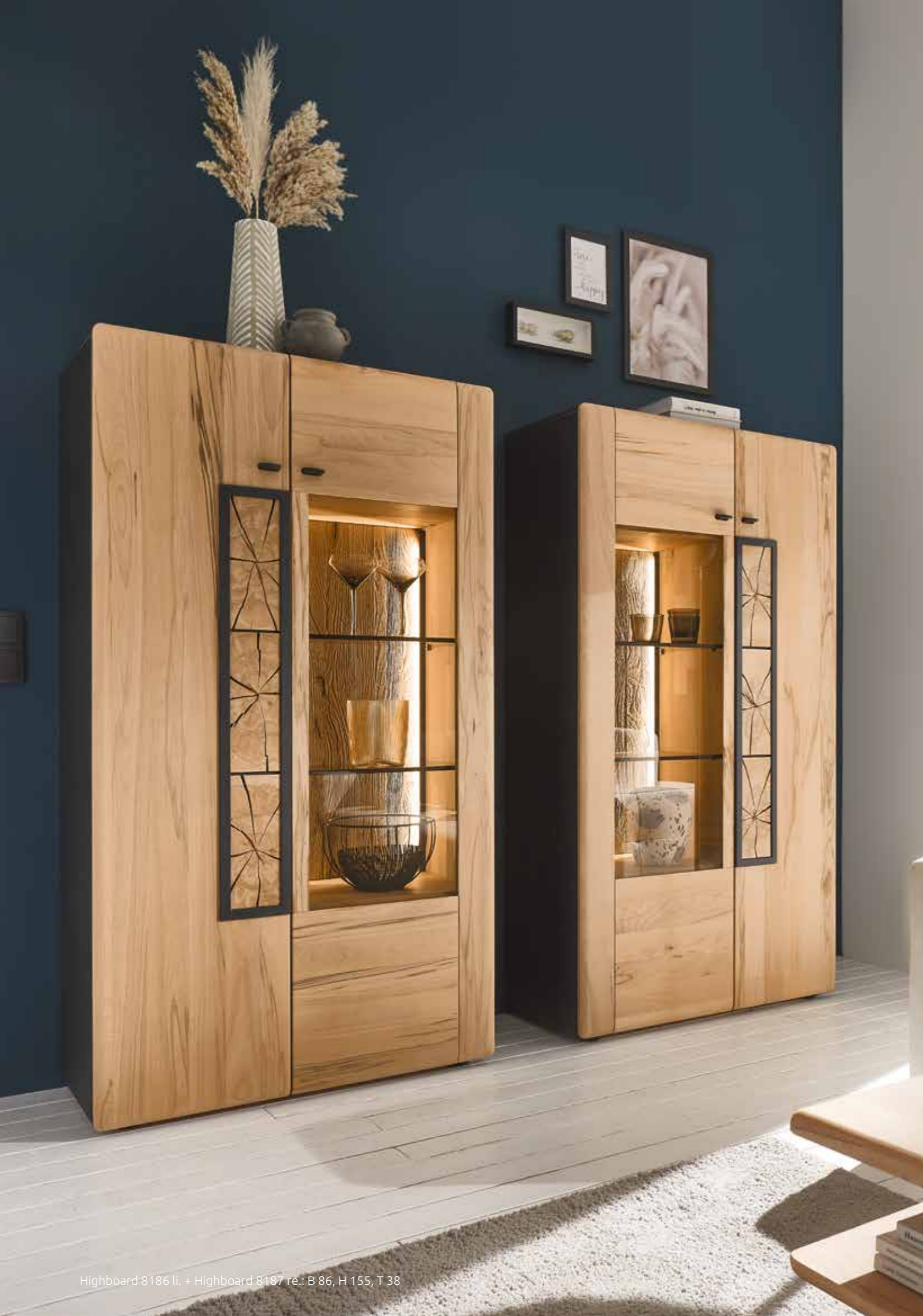
Highboard 8186 li. + Highboard 8187 re.: B 86, H 155, T 38