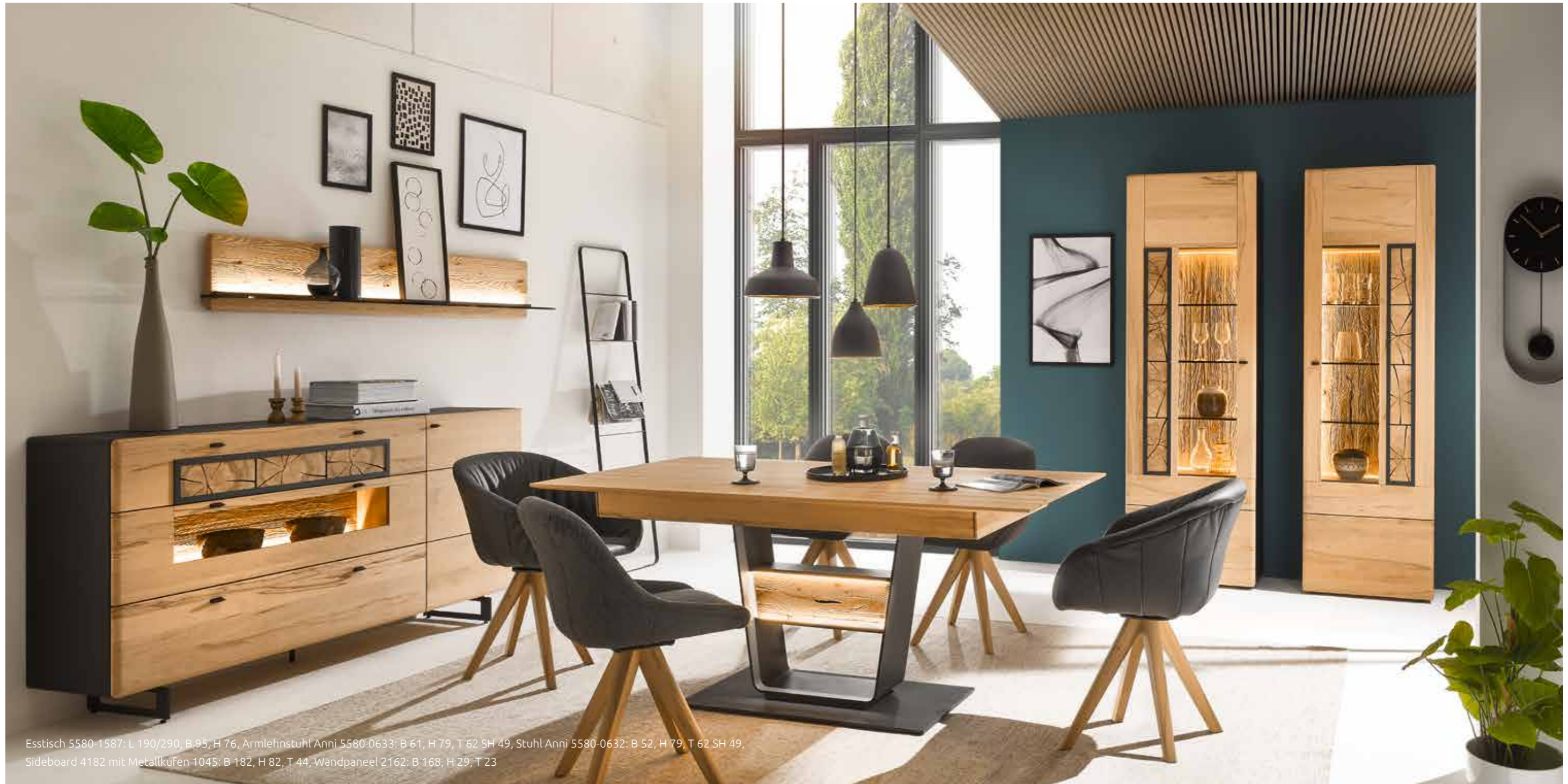
Esstisch 5580-1587: L 190/290, B 95, H 76, Armlehnstuhl Anni 5580-0633: B 61, H 79, T 62 SH 49, Stuhl Anni 5580-0632: B 52, H 79, T 62 SH 49, Sideboard 4182 mit Metallkufen 1045: B 182, H 82, T 44, Wandpaneel 2162: B 168, H 29, T 23